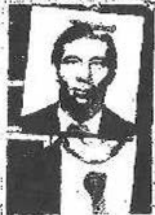
Victor Hugo Morales