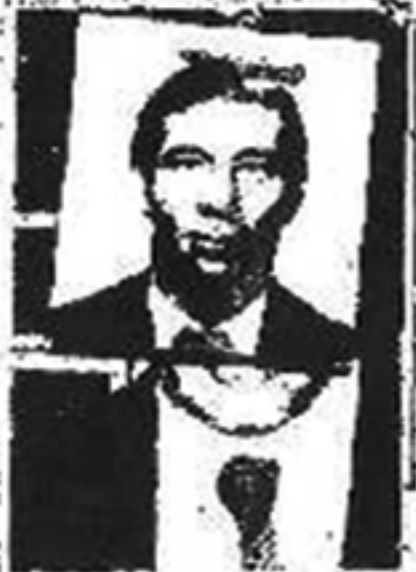
Victor Hugo Morales